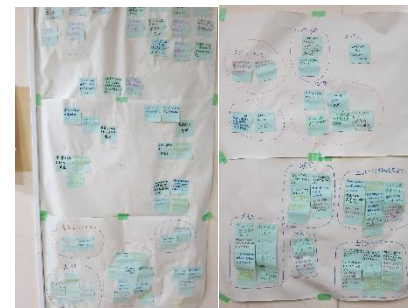
↑ 1 組の模造紙