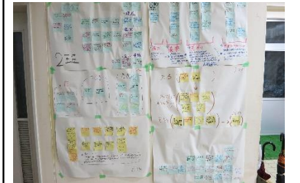
↑ 3 組の模造紙