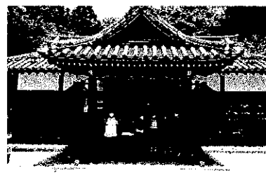
・チェックポイントの糸井神社