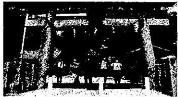
・チェックポイントの八幡神社