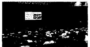
・講演会 三宅町文化ホール