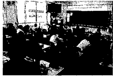
・校外学習当日事前学習