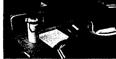
・校外学習当日事後学習

天候にも恵まれ、無事に校外学習を終えることが出来ました。生徒たちは、スケジュールの詰まっている中、川西町・三宅町を精一杯散策してくれました。地元のことや隣町について知る機会が出来て良かったと感じた生徒が多く、充実した学びにつながった良いフィールドワークになりました。