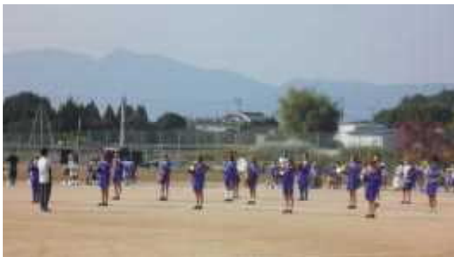
開会式 (ファンファーレ&校歌)