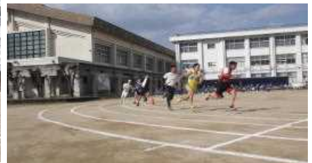
運動部男子+教員チーム