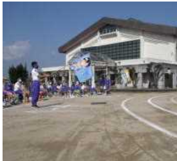
選手宣誓に合わせ、 学級旗を掲げる