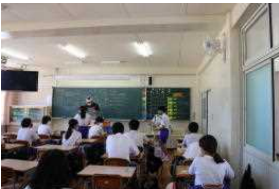
配膳時の様子 盛り付け時はビニール手袋を着用し、原則として、担任と当番生徒1名で行います。各自で順番に自分の分の食事を取りに行って席に着きます。