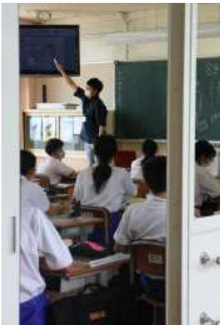
1年社会科授業の様子 換気が心がけていきます。