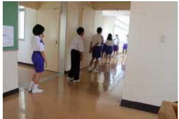
給食前の手洗いの様子 給食当番は手洗い後エプロン・三角巾・マスクを着用して、給食室へ向かいます。写真は、その他の生徒が順番に手洗いをしている様子です。