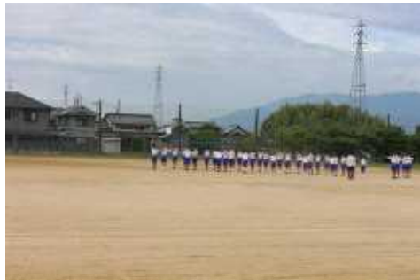
1年体育科授業の様子 内容によってマスクを着脱します。