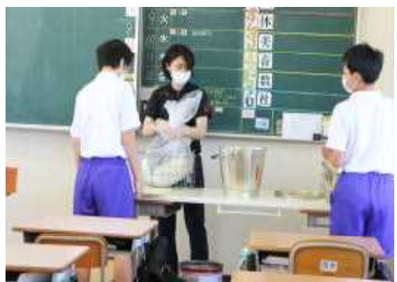
食事後の食器は、大きなビニール袋に包んでから食器かごに入れて給食室に戻します。