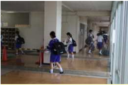
登校時に、昇降口でアルコール手指消毒をします。