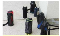
体育授業の途中で水分補給をします。(昇降口に置いておきます。)