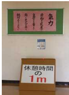
“密接”を避けることを掲示物でも呼びかけています。