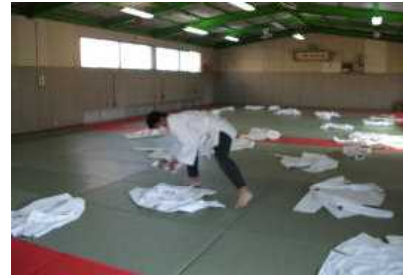
2年で必修の武道(柔道)の道着は共用ですので、消毒を励行しています。