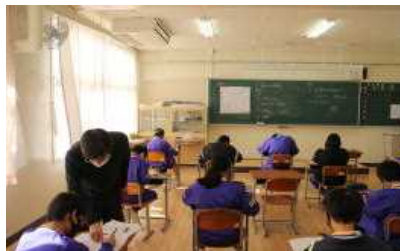
1 年数学 少人数授業 個別に疑問に答えています。