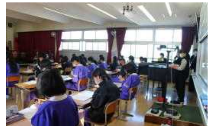
1 年音楽 クラッピング（リズム打ち）の様子