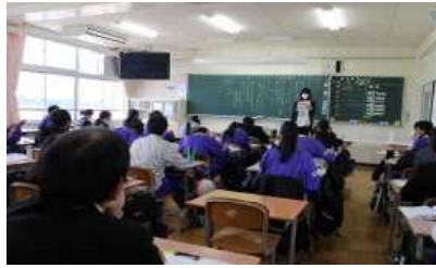
道徳授業 11月13日に研究授業を行い、3名の方から指導助言をいただきました。(写真は2年生)