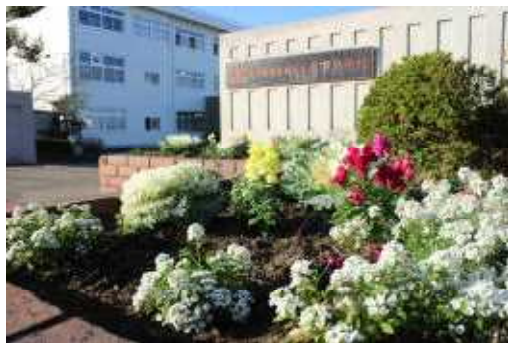
石見自治会フラワーチームのみなさんの御協力ですられた校門前花壇