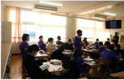
2年英語 ペアスピーチを行っている様子