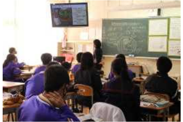
3年理科 映像や発表用ホワイトボードを活用した授業の様子