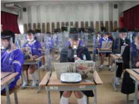
3年音楽 リコーダー奏 仕切り板を使用して演奏しています。