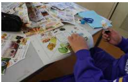
1 年家庭 基礎食品群についてチラシを使ってまとめる学習